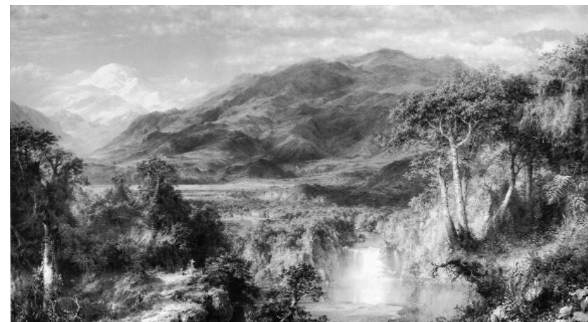
Ф. Черч. Сердце Анд, 1859

Спустя 4 года Занисер повторил свои предложения на Конференции по национальным паркам и на Четвертой Конференции по дикой природе. Последняя поддержала Занисера резолюцией о необходимости принятия Закона «О дикой природе».