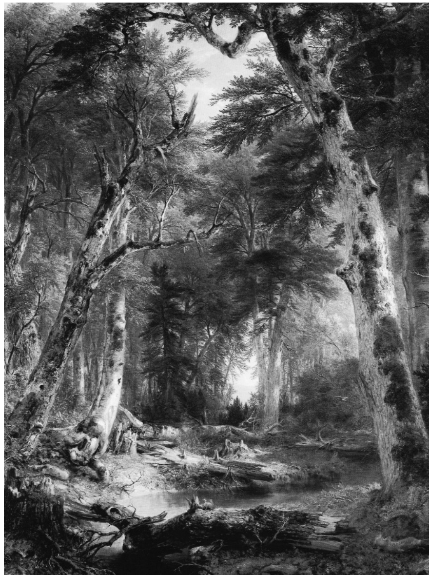
Э. Дюранд. В лесу, 1885

хаоса и путаницы (10). И далее Тернер спрашивает: «Почему бы не выделить обширные области дикой природы, где мы ограничиваем все формы человеческого вмешательства: никаких