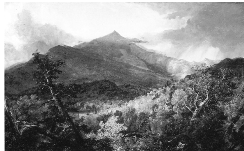
Т. Коул. Гора Шрун, 1838

К 1914 г. в США уже имелось 11 национальных парков и 28 национальных памятников. Среди созданных до 1914 г. были