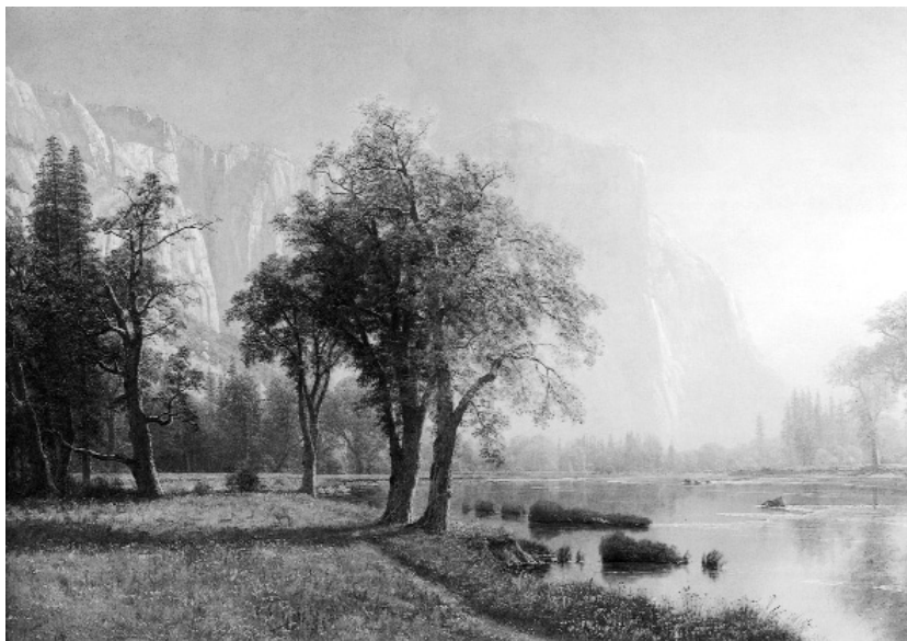
А. Бирштадт. Йосемитская долина, 1875

такие национальные парки: парк генерала Гранта (2536 акров), Секвойя-парк (161.597 акров), созданные в 1890 г., Ледниковый национальный парк (915000 акров), созданный в 1910 г., национальный парк горы Реньэ (207306 акров), созданный в 1899 г., национальный парк Кратерного озера (159360 акров) созданный в 1902 г., парк Меза-Верде (42376 акров), созданный в 1905 г., национальный парк Ветряной пещеры (10522 акров), созданный в 1903 г., а также два национальных парка, созданных в 1904 г. — национальный парк Плат и Сулис Хилл (по 848 и 780 акров) (35). Следует особо подчеркнуть, что первые американские национальные парки больше охраняли «природные диковинки», чем природные экосистемы. Они создавались там, где не было полезных ископаемых и невозможно вести сельское хозяйство.