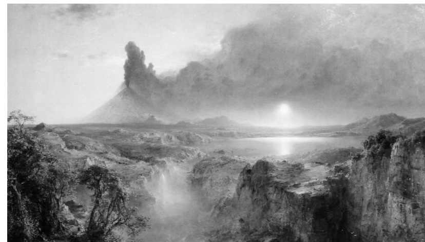
Ф. Черч. Котопахи , 1862

мнения экспертов, поддерживающих сооружение плотины. В сравнении с этим литературная кампания природоохранников оказалась слабее.