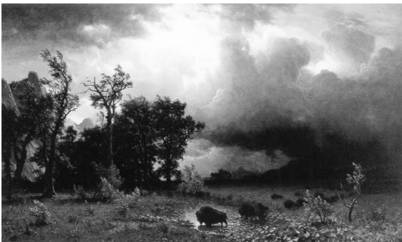
А. Бирштадт. Путь бизонов. Приближение грозы, 1869

Теодор Рузвельт лично побывал в Гранд Каньоне, где заявил: «Ничего не делайте такого, что может испортить великолепие этих мест. Оставьте эти места для своих детей и для детей ваших детей, и для всех, кто придет после вас, потому что это великолепное место достойно того, чтобы быть увиденным каждым американцем» (37). «Это было похоже на присутствие в торжественном соборе. Эти места намного красивее, чем любое здание, построенной рукой человека» — писал позже Т. Рузвельт (37).