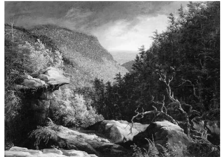
Т. Коул. Катскилл Клов, 1827

Коул полагал, что если природа не тронута человеком, тогда людям легче познакомиться с рукой Бога. Он свято верил, что если дикий американский ландшафт был новым Эдемским садом, то именно они, художники, хранят ключи от его входа. По его мнению, только жизнь, прожитая в гармонии с дикой при-