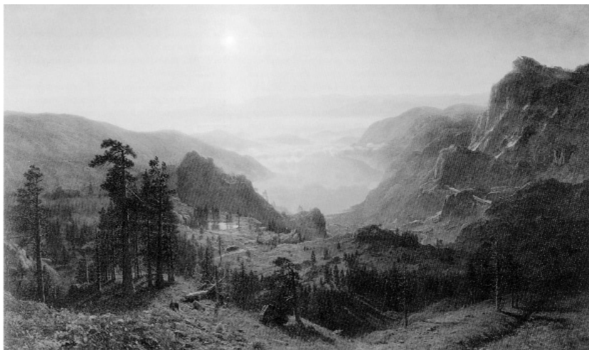
А. Бирштадт. Озеро Доннер , 1867

Несмотря на то, что многие защитники дикой природы были разочарованы либеральной версией утвержденного билля, он все же стал по настоящему революционным законом. Впервые