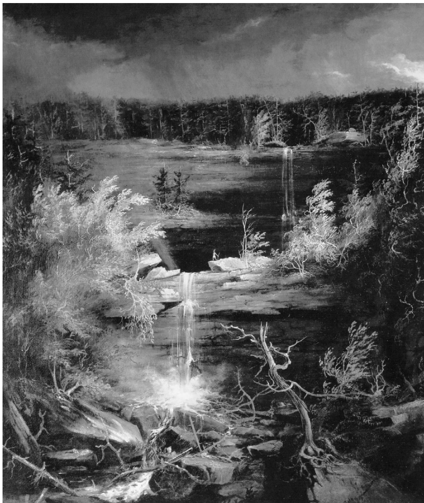
Т. Коул. Водопад Каатерскил , 1826

родой, обещала интеллектуальное обновление и здоровый прогресс. Коул говорил: «Дикая природа — это самое подходящее место для разговора о Боге», и старался придавать своим картинам религиозное и нравственное значение (8).