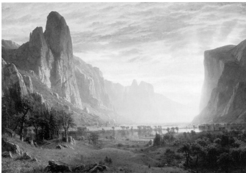
А. Бирштадт. Взгляд вниз на Йосемитскую долину, 1865

Земля дремлющих и светлых деревьев! Земля ушедшего заката, Земля туманных горных пиков! Земля стеклянного света полной луны, Слегка разбавленного голубизной (7).