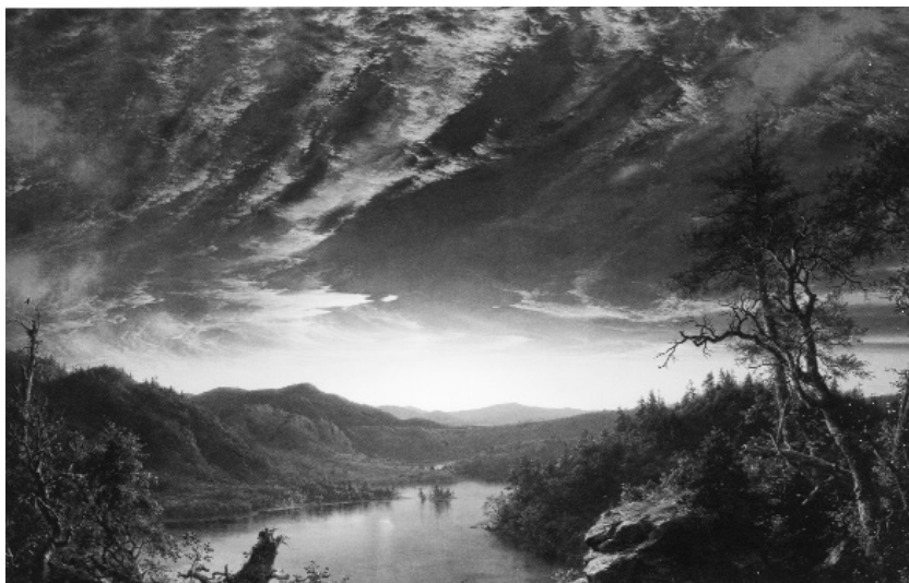
Ф. Черч. Сумерки в дикой природе, 1860

В 19 веке первоначальной идеей американских национальных парков была защита «пейзажных чудес». Научные и экологические ценности стали упоминаться гораздо позже. Уже в 1920-х годах начали говорить и о диких животных: «к очарованию ландшафтов они добавляют колдовство движения» (21). Примерно в это же время национальные парки постепенно стали создаваться и в восточной части страны, где не было «пейзажных диковинок». Постепенно природоохранники, а затем и рядовые американцы осознали, что главное различие между городскими парками и национальными парками состоит в наличии дикой природы у последних. Городские парки тоже могут быть зрелищными, но природа в них не дикая.