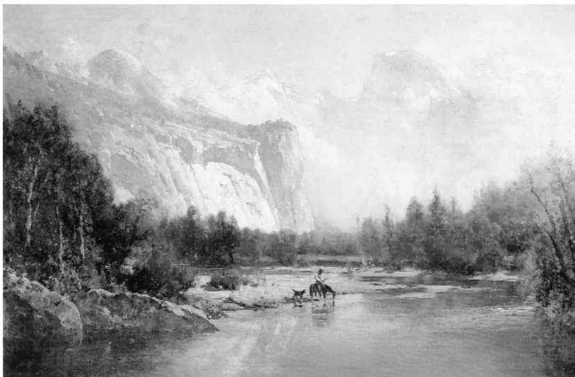
Х. Томас. Туман в каньоне Тенайя, 1885

В настоящее время в ряде американских университетов: Юридический Университет Пейс, Университет Тафтс, Северо-восточный Юридический Университет, Юридический Университет Джона Маршалла, Калифорнийский западный Юридический Университет, Хастингский Юридический Университет,