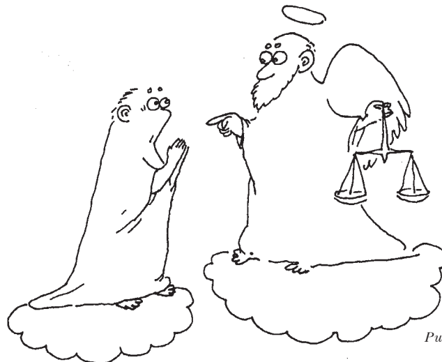
Рис. Э.Д. Шукурова

— Исповедовал ли ты экологию? Благоговел ли ты перед жизнью? Сотрудничал ли ты с журналом Гуманитарным экологическим?